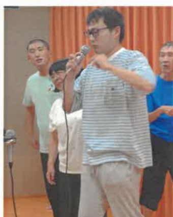
仲間旅行の一番の楽しみ カラオケタイム♪