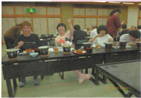
宴会で一年の疲れをいやす