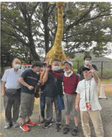
姫路セントラルパーク