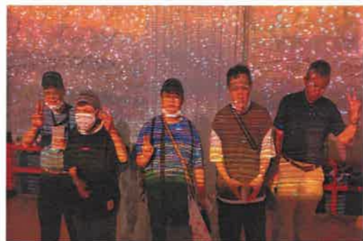
神戸 a t o a 水族館