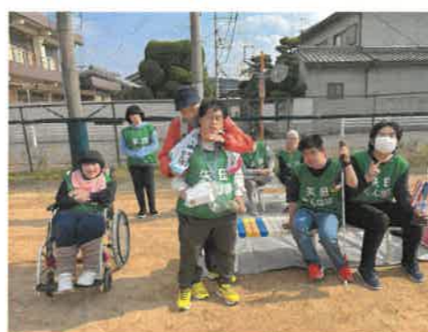
優勝は矢田たんぼぼでした!!

先月、大阪帝陵ライオンズクラブ様よりクリスマスプレゼントをいただきました。突然のプレゼントに利用者さんは大喜びでした。いつもあたたかい心遣いをいただき、利用者・スタッフ一同より感謝しております、本当にありがとうございました。