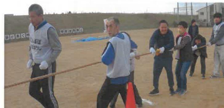
事業所対抗の綱引き みんなで力を合わせて戦いました